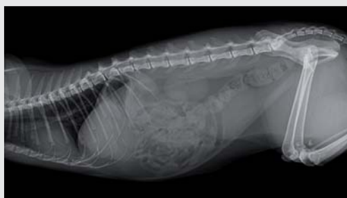
Aufnahme mit DX-R Bildprozessing