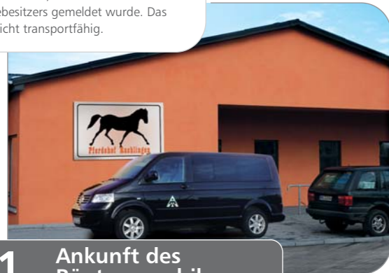
1. Ankunft des Röntgenmobils

Ankunft des Tierarztes mit dem Praxismobil auf dem Pferdehof, nachdem ihm ein Notfall des Pferdebesitzers gemeldet wurde. Das Pferd ist nicht transportfähig.