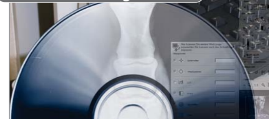
10. Weitergabe der Röntgenbilder

Röntgenbilder (inklusive kostenlosem Betrachtungsprogramm) können in Originalqualität auf CD gebrannt und dem Tierhalter übergeben werden.