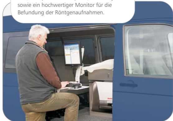
2. Röntgenauftragserteilung im Fahrzeug

Im Innenraum des Röntgenmobils befindet sich, transportsicher verpackt, das CR-System sowie ein hochwertiger Monitor für die Befundung der Röntgenaufnahmen.