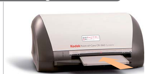
6. Auslesen des Röntgenbildes

Die Kassette wird in das Speicherfoliengerät eingelegt und binnen weniger Sekunden ausgelesen. Automatisch werden die Bildverarbeitungsparameter anhand der anatomischen Region gewählt. Am Bildschirm können Änderungen wie Drehen, Invertieren, Kontrast, Helligkeit oder Parametermodifikationen vorgenommen werden.