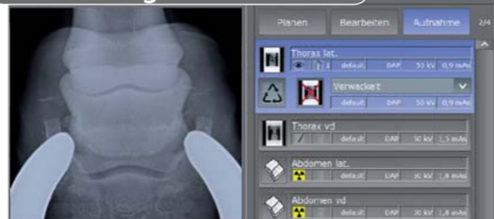
8. Das digitale Röntgenbild

Nun steht die Röntgenaufnahme in höchster Qualität am Befundplatz im Röntgenmobil zur Verfügung.