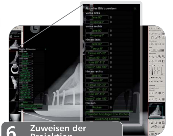
6. Zuweisen der Projektion