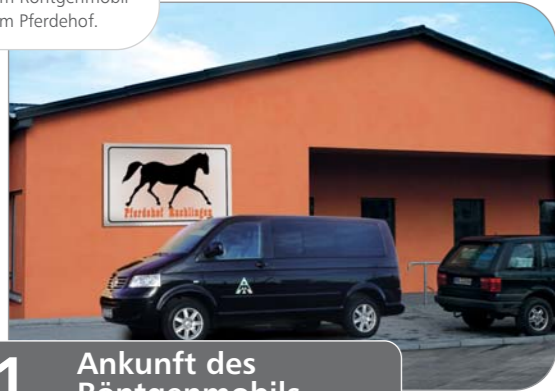
1. Ankunft des Röntgenmobils

Ankunft des Tierarztes mit dem Röntgenmobil auf dem Pferdehof.