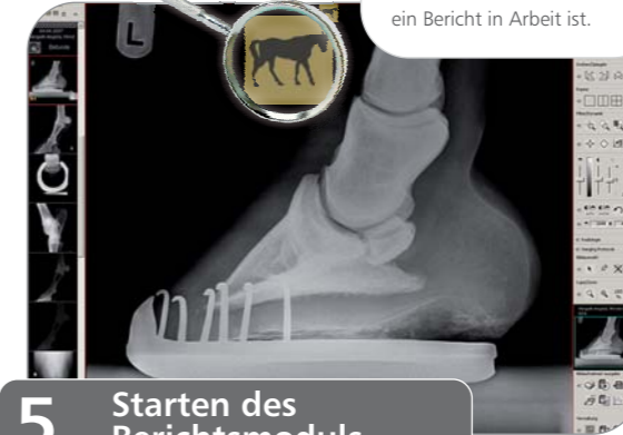
5. Starten des Berichtsmoduls

Dieses Symbol erscheint, wenn für eine Untersuchung ein Bericht in Arbeit ist.