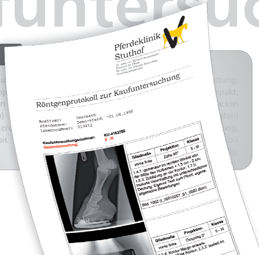
11. Bericht an die Untersuchung anhängen

Tibia Isolierte Verschattung einzelnes Dissekat, kompakte Randwülste und -zacken bis 2 mm (Osteophyten) krallenförmige Deformierung deutlich; mittelgradig bis vollständig;