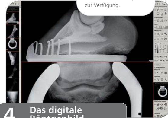
4. Das digitale Röntgenbild

Die Röntgenaufnahmen stehen in höchster Qualität zur Verfügung.