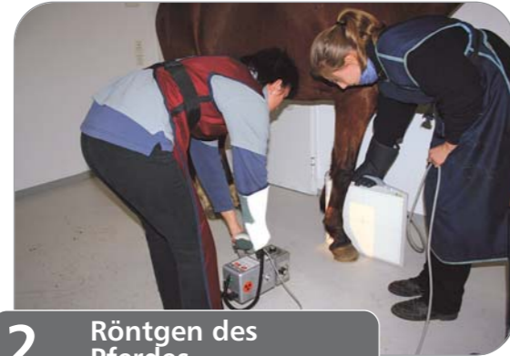
2. Röntgen des Pferdes

Aufruf der zu bearbeitenden Untersuchung aus der Tagesliste.