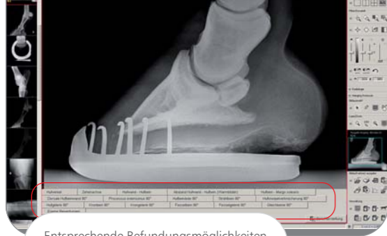
7. Einblenden der Befundmöglichkeiten

Entsprechende Befundmöglichkeiten werden automatisch eingeblendet.