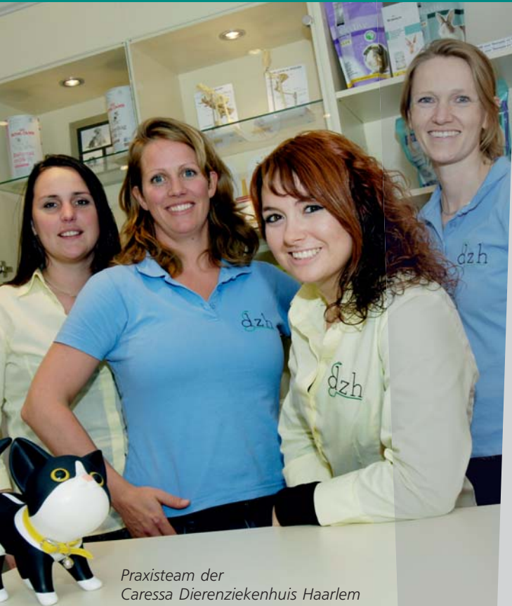
Praxisteam der Caressa Dierenziekenhuis Haarlem