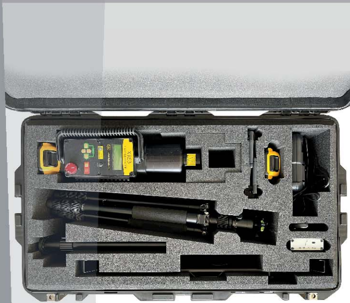
[Generator inkl. Generator-Zubehör sind nicht im Lieferumfang enthalten.]