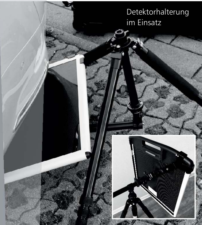
Detektorhalterung im Einsatz