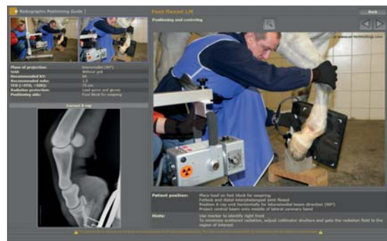
Integrierter, multimedialer Röntgenhelfer