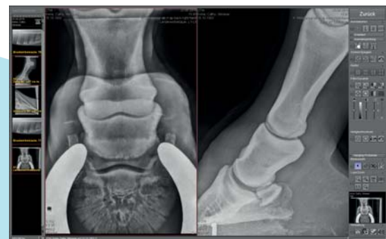
Befundung im professionellen PACS-Viewer