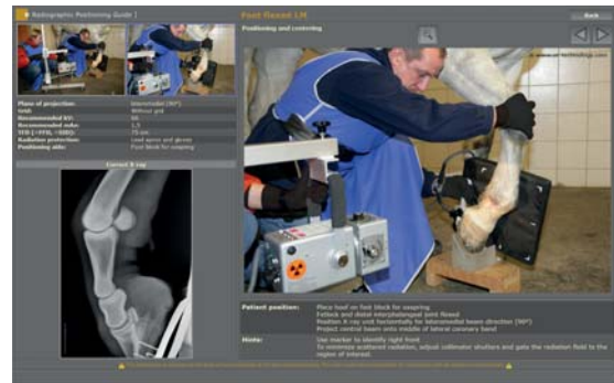
Integrierter, multimedialer Röntgenhelfer