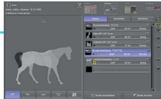
Planung der Röntgenuntersuchung

Erlaubt den Einsatz im Dentalbereich , z. B. eines Digital-Zahnsensors oder eines CR-Dental-Systems