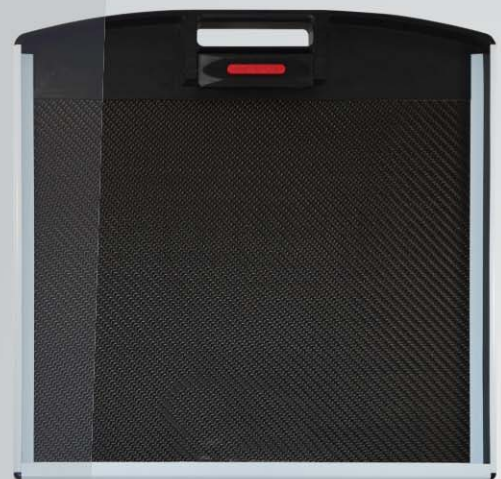
Rückseite mit Verriegelung

Alle dargestellten Logos, Bilder und Grafiken sind Eigentum der entsprechenden Firmen und unterliegen dem Copyright der entsprechenden Lizenzgeber. Sämtliche auf diesen Seiten dargestellten Fotos, Logos und Texte, die Eigenentwicklungen von uns sind oder von uns aufbereitet wurden, dürfen nicht ohne unser Einverständnis kopiert oder anderweitig genutzt werden. Alle Rechte vorbehalten.