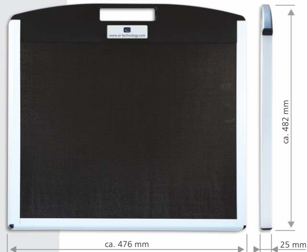
Maße der Schutzhülle

Ausführliche Informationen finden Sie unter www.oehm-rehbein.de